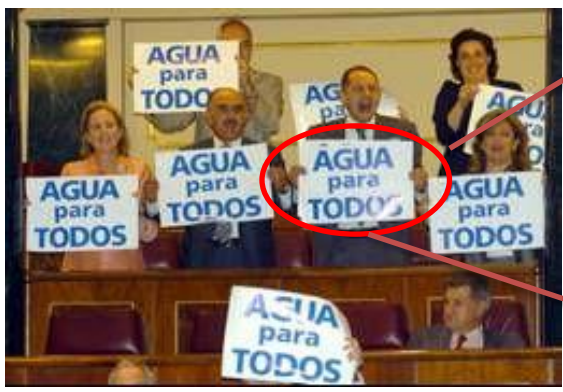
Figura 1. Ejemplo de criticidad

“Partido Popular (PP): El agua debe ser para todos. Sí al trasvase del río Ebro.